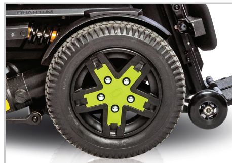
Cerchi colorati di serie